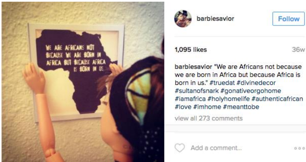
Figure A. L'auto-gratification de « White Savior Barbie » tout en appropriant une identité africaine à soi-même.