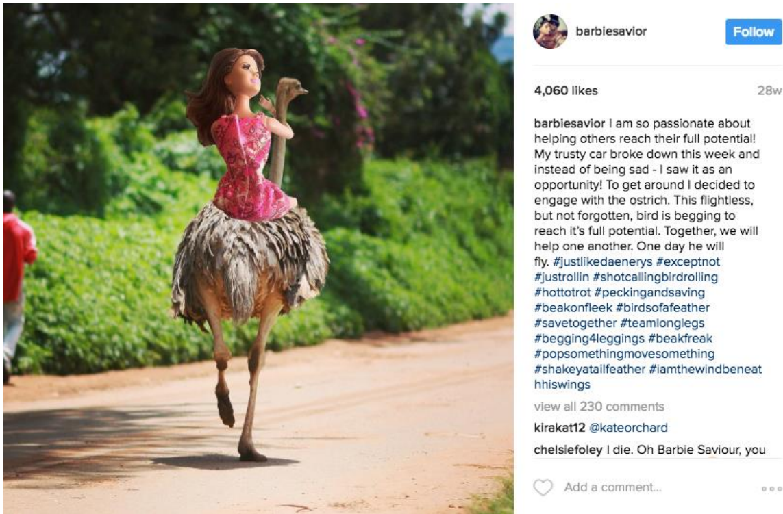
Figure C. La perception de l'Afrique comme quelque chose de primitive.