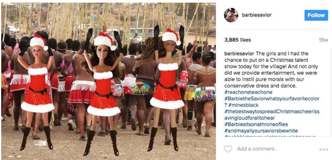
Figure D. L'égoïsme de la culture occidentale vis-à-vis une culture distincte.