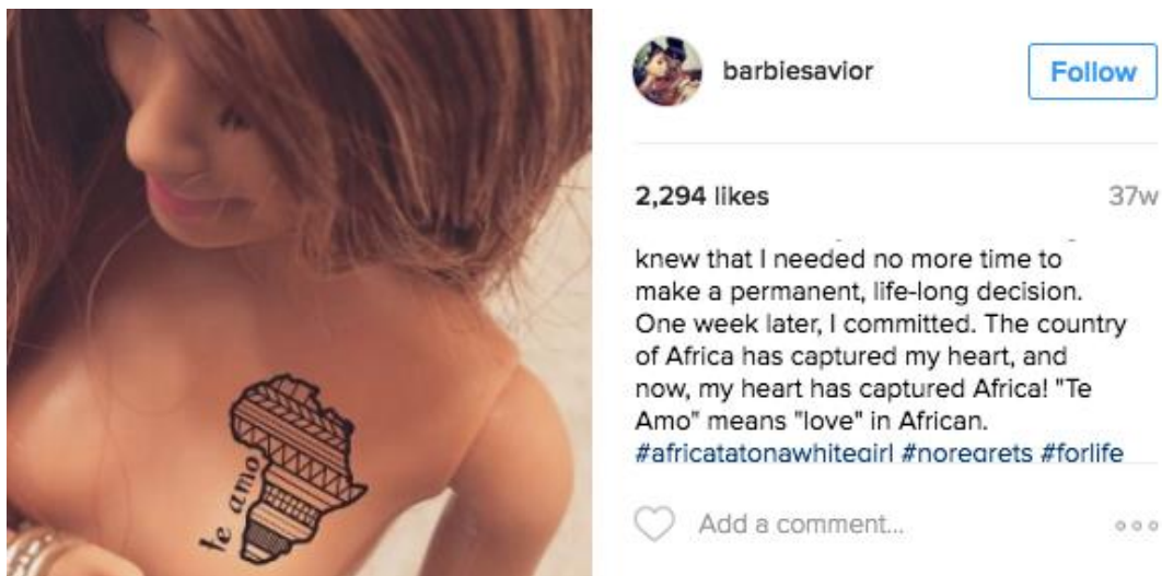
Figure B. L'hyperbole d'une attitude ignorante vers le volontourisme en Afrique.