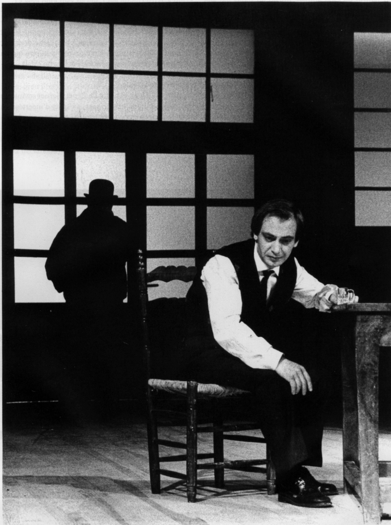
La fageda, estrenada a la Sala Beckett el 1990, és un antecedent de Desig.