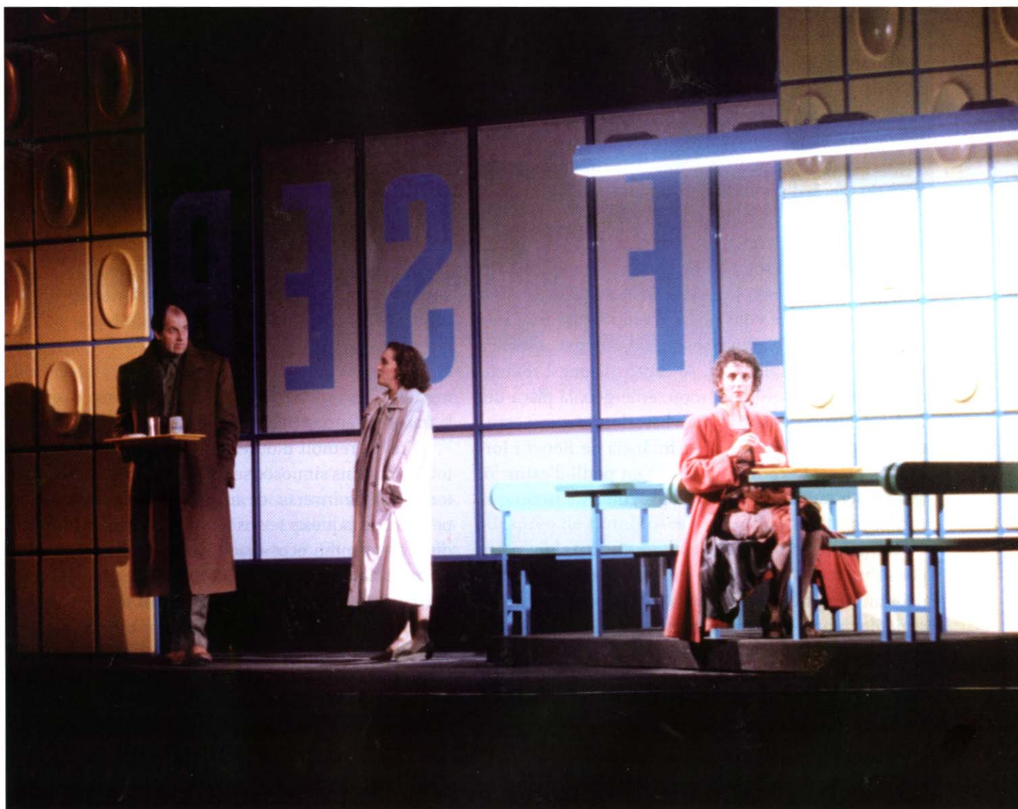
Desig va obrir nous camins dins la història del teatre català.

A partir de Desig , la dramaturgia de Benet i Jornet s'omple d'aquestes expressions circumlocutòries, com fins i tot suggereix el títol Com dir-ho . L'espectador que